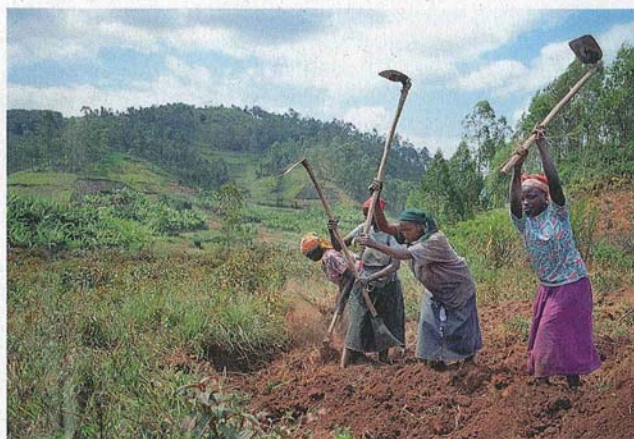
In Afrika (hier: Malawi) kämpfen die Bauern nicht nur gegen widrige Bedingungen, sondern auch gegen subventionierte Agrarprodukte aus der EU.